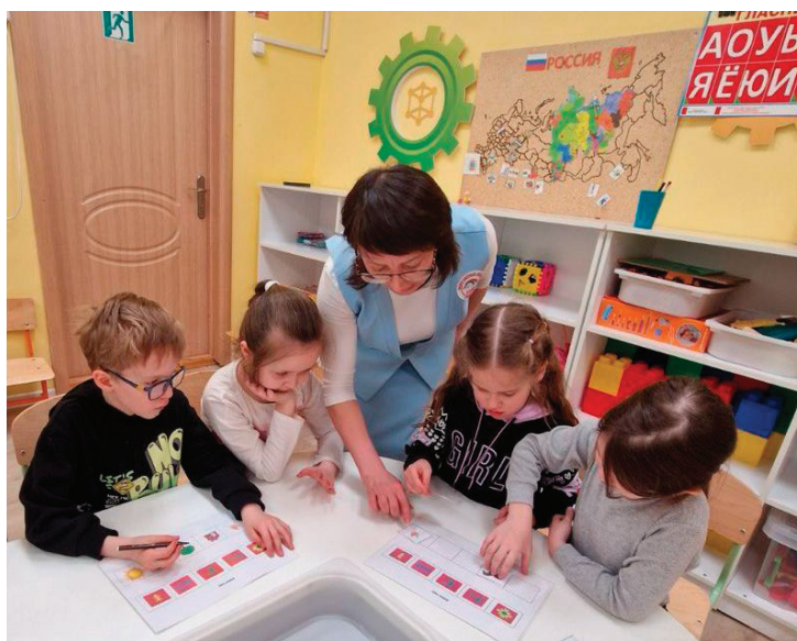
Рис. 1. Мастер-класс по изучению символики чувашской вышивки

Положительный результат проведения мастер-класса с детьми дошкольного возраста, состоит в том, что активный педагог использует механизм обучения, с помощью которого он анализирует свой педагогический опыт и находит способы обновления своей профессиональной потенции. Пассивный педагог, выполняя определенный алгоритм действий, включается в активную познавательную деятельность (рис. 1).