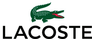
Рис. 4. Логотип Lacoste

Lacoste как символ атаки и безупречного стиля. Репрезентатив представлен стилизованным зеленым изображением крокодила, развернутого влево (см. рис. 4). Объектом является компания Lacoste и ее продукция. Интерпретанта выражается в качестве, ассоциируемые с крокодилом и перенесенные на бренд: аристократизм, элегантность, сила, выносливость. Также интерпретанта включает в себя историю успеха самого Лакоста, связь со спортом и высокими достижениями. Знак является иконой, так как имеет прямое изобразительное сходство с крокодилом. Одновременно это индекс, так как он указывает на причину своего появления — личность Рене Лакоста. Со временем изображение крокодила стало символом определенного социального статуса, французской изысканности в повседневной одежде. Денотация представлена в виде фирменного знака производителя одежды Lacoste. Коннотация вызывает ассоциации со спортивным аристократизмом, успехом, принадлежностью к определенному социальному слою, качеством, Францией, теннисом [1].