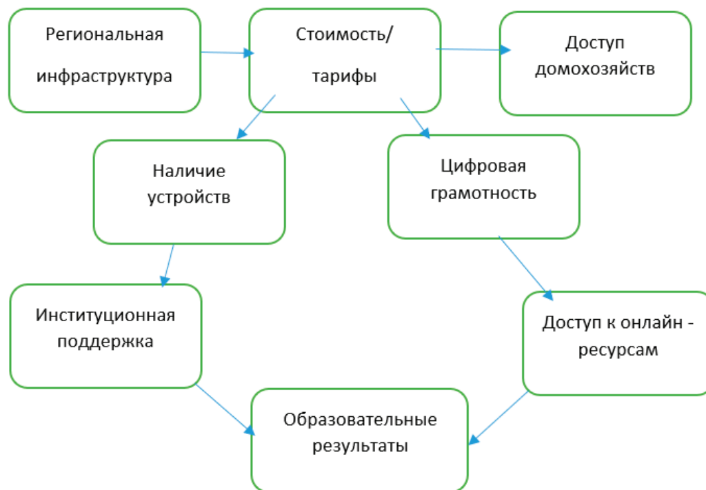
Рис. 1. Причинно-следственные цепочки доступа к онлайн-ресурсам

социальное неравенство. Уровень образования и цифровой грамотности населения также влияет на использование интернет-ресурсов. В регионах с низким уровнем образования и высоким уровнем безработицы люди могут не осознавать преимуществ, которые представляет интернет и не иметь навыков для его эффективного использования.