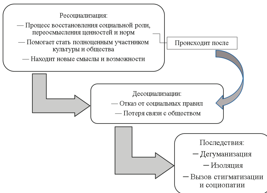
Рис. 1. Ресоциализация и десоциализации

Социализация помогает студентам стать частью общества, развивать свою индивидуальность, а также адаптироваться к изменениям в социальной среде. Для людей с особыми потребностями процесс социализации может быть значительно сложнее из-за физических, эмоциональных и когнитивных ограничений. Однако его значение невозможно переоценить: он способствует развитию личной идентичности, уверенности в себе и обеспечивает возможность полноценного участия в жизни общества. Существует множество стереотипов и предвзятых мнений, связанных с людьми с особыми потребностями, которые зачастую воспринимаются как зависимые или неспособные к самостоятельной жизни. Однако современное общество все больше осознает, что каждый человек, независимо от своих ограничений, имеет право на полноценное участие в социальной жизни. Это требует изменения подходов к обучению и социализации, внедрения инклюзивных методов, учитывающих индивидуальные особенности каждого человека. [3] в последние десятилетия в области образования и социальной работы разработано множество методов поддержки людей с особыми потребностями. Эти методы варьируются от индивидуальных образовательных программ до использования современных технологий, таких как адаптивные приложения и онлайн-ресурсы. Важным аспектом является вовлечение семьи и сообщества в процесс социализации, что создает более благоприятную среду для развития.