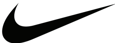
Рис. 1. Логотип Nike «Swoosh»

Логотип Google — это сложный символ, который использует комбинацию шрифтового решения и цвета для передачи своих ценностей (см. рис. 3). Объектом является корпорация Google LLC, ее продукты, а также поисковая система Google как основной продукт. Название компании является ошибочным написанием слова «googol» (гугол) — математического термина, обозначающего единицу со ста нулями. Это прямо указывает на миссию компании и интерпретанту: структурировать и сделать доступным необъятное количество информации в интернете. Таким образом, логотип символизирует бесконечную информацию и технологическую мощь. Упрощенный, геометрический, дружелюбный без за-