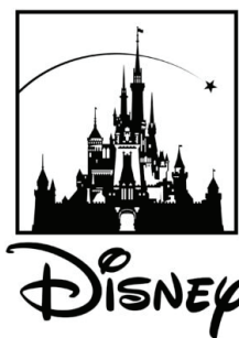
Рис. 7. Логотип Disney

Для того, чтобы сравнить различия восприятия логотипов у носителей английского и русского языков, ассоциации были собраны в Таблице 1.