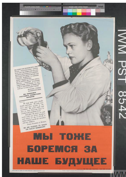
Рис. 3. Плакат «Мы также боремся за наше будущее» [7]

Министерство информации разрабатывало материалы, ориентированные также на союзнические страны, в особенности Советский Союз и Францию. Их ключевой темой являлось освещение гуманитарной и военной поддержки, оказываемой Великобританией. Наглядным примером служит агитационный плакат «Мы тоже сражаемся за наше будущее» см. рис. 3.