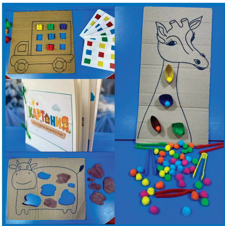
Рис. 1. Сборник дидактических игр из картона «КАРТОНИЯ»

В качестве основного материала для игр был выбран бросовый материал картон: коробки из-под продуктов, картонные втулки, крышки, прищепки и другие элементы. Выбор данного материала не случаен. Картон безопасен, лёгок, приятен на ощупь, легко поддаётся обработке и трансформации. Кроме того, он доступен в большом количестве в условиях дошкольного учреждения, что де-