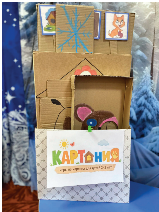
Рис. 3. Коробка с картонными играми «КАРТОНИЯ»

Таким образом, опыт создания и внедрения сборника дидактических игр из картона «КАРТОНИЯ» подтверждает, что развивающая образовательная среда для детей раннего возраста может быть эффективно организована на основе простых и доступных материалов. Практико-ориентированный характер данной разработки позволяет ис-