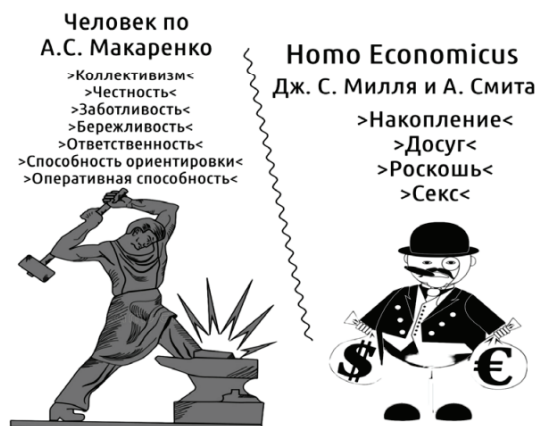
Рис. 1. Различие человека по А. С. Макаренко и Дж. С. Миллю [4, стр. 10]

Возможная практика внедрения элементов методики А. С. Макаренко в современную образовательную систему