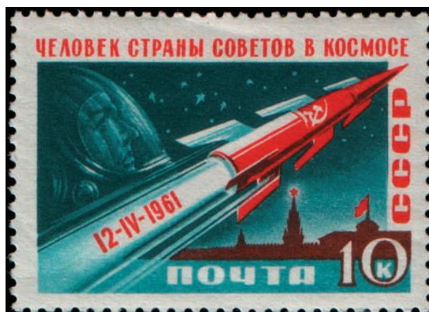
Рис. 1. Почтовая марка СССР. 1961. Серия «Первый полёт человека в космос». Портрет Ю. А. Гагарина. 10 коп. (ЦФА № 2562). Художник И. Левин