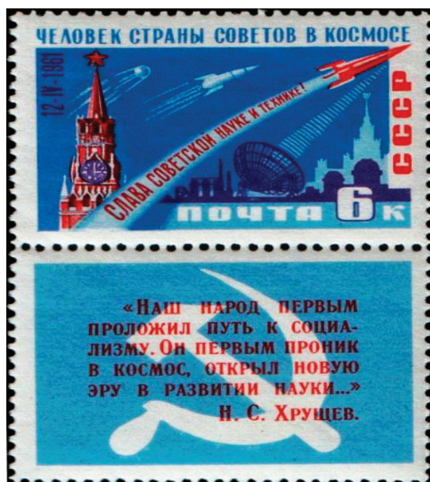
Рис. 2. Почтовая марка СССР 1961 г. с изображением ракеты-носителя «Восток» (ЦФА № 2561). Художник И. Левин