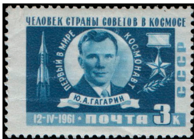
Рис. 3. Почтовая марка СССР 1961 г. (ЦФА № 2560). Художник И. Левин. Портрет Ю. А. Гагарина и ракета-носитель «Восток»