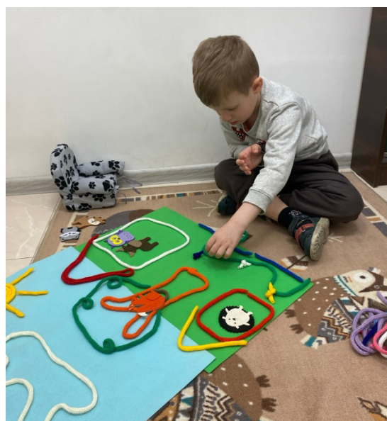
Рис. 1. Процесс создания истории с помощью набора «Вязаная графика»

Ассортимент для создания историй разнообразен. Чем привлекает меня «Вязаная графика»? Текстильные карандаши приятны на ощупь, у ребенка они вызывают приятные ощущения. Иногда это и способ установить контакт, в других случаях — возможность узнать о потребностях и эмоциональном состоянии, страхах и тревогах. Процесс рисования с помощью текстильных карандашей представлен на рис. 1.