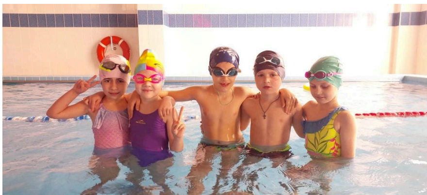
Рис. 1. Подгруппа дошкольников на занятии в бассейне «Жемчужина»

но современные дети испытывают его дефицит в связи с увлечением компьютерными играми, всевозможными гаджетами, просмотром интернет-контента и телевизора.